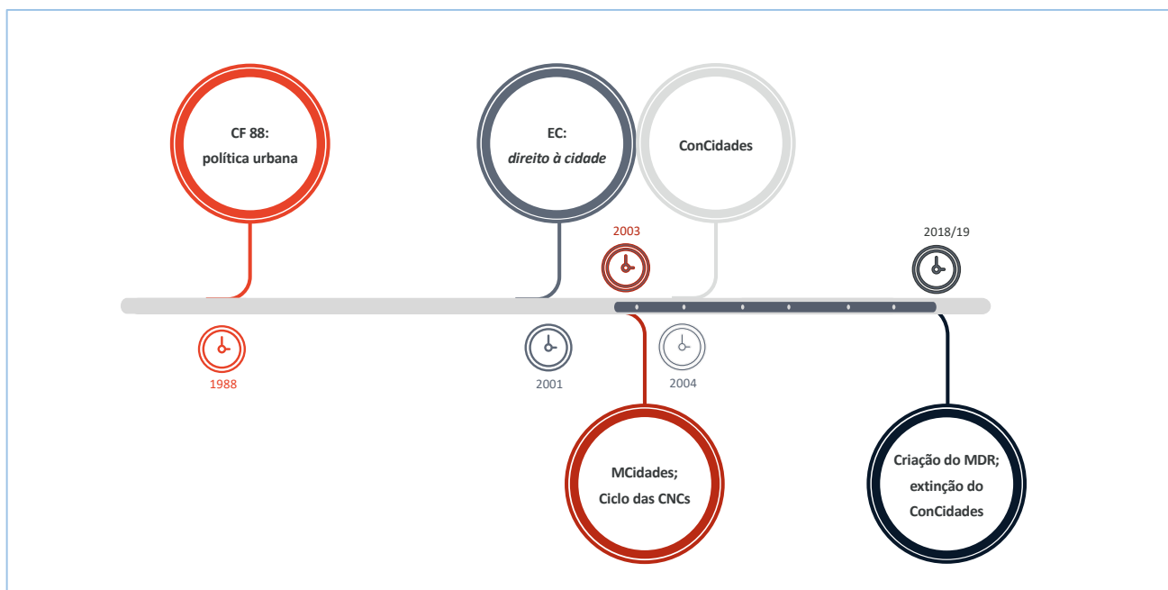
Figura 2 – Linha do tempo da política urbana pós-CF 88

Na análise cronológica jurídica, enfocam-se os elementos jurídico-normativos estruturantes que informam sobre este período de construção de uma gestão urbana democrática: além da própria CF 88, tem-se o Estatuto da Cidade (EC) (Lei Federal nº 10.257, de 20/07/2001); a Lei dos Consórcios Públicos (Lei Federal nº 11.107, de 06/04/2005), instrumento de articulação interfederativa com potencial de colaborar com a gestão municipal; e o Estatuto da Metrópole (EM) (Lei Federal nº 13.089, de 12/01/2015), para ficar apenas em três marcos normativos, aos quais poderiam ser somados os relativos às políticas setoriais e outros associados às normas sobre questões político-institucionais e os instrumentos de gestão democrática.