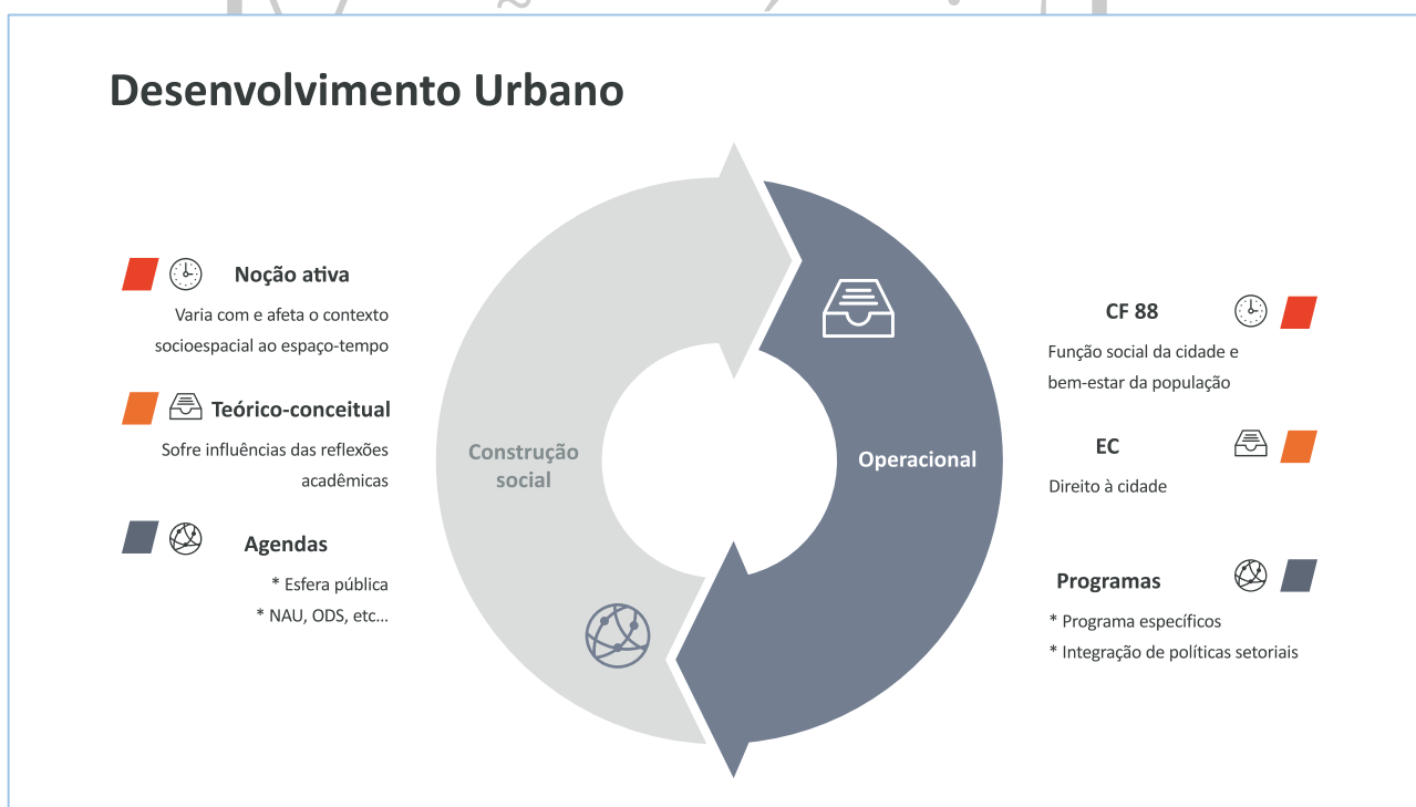
Figura 1 – Os enfoques/dimensões da noção de desenvolvimento urbano

A noção de desenvolvimento urbano não é externa às dimensões do tempo-espaço-ser. É uma noção ativa que varia com os contextos socioespaciais e é, ela mesma, uma resultante de reflexões teórico-