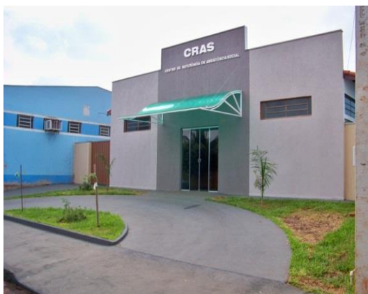
Município de Aramina/SP

DESCRIÇÃO: Unidade pública municipal, de base territorial, responsável pela organização e oferta de serviços da proteção social básica do SUAS. Possui interface com as demais políticas públicas e se caracteriza como a principal “porta de entrada” do SUAS, possibilitando, assim, o acesso das famílias e indivíduos à rede de proteção social de assistência social.