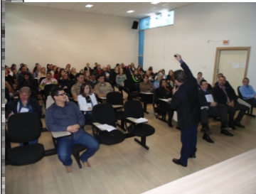
I Seminário da Rede de Atendimento da Criança e Adolescente do Planalto Norte (24 e 25-10)