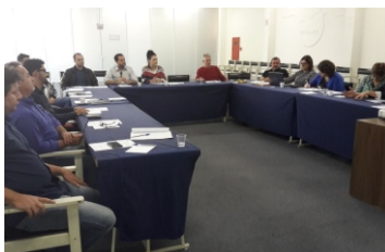
Colegiado Estadual Assistência Social (11 e 12-09) e (20 e 21-11)