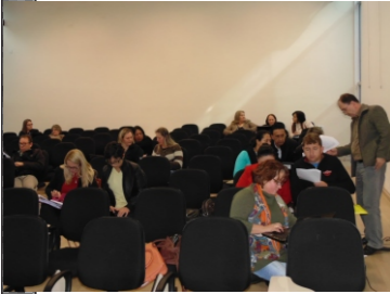
Plano de Carreira da Educação (23-05)