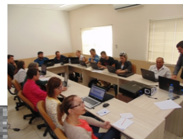
Operacionalização dos serviços tecnológicos da FECAM (21-03)