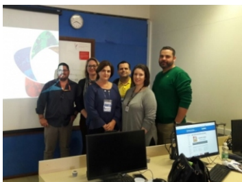
Reunião de Trabalho 13019/14 FECAM (16-10)