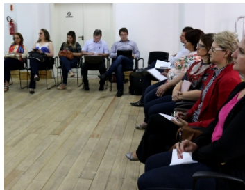
Colegiado Estadual de Educação (12-09) e (20-11)