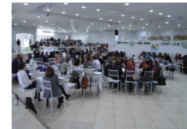
Seminário de gestores da Educação (06-06)