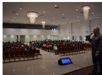
Seminário de Assistência Social (24, 25 e 26-05)