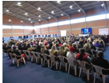
Seminário Educação Infantil-UNC (20, 21-07) A arte como elo de interação no processo de ensino e aprendizagem