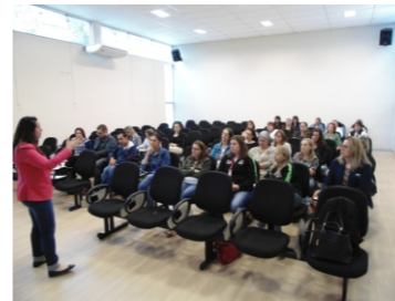
Roda de conversa Planos Municipais de Assistência Social (19-09)