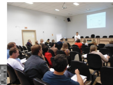
CPA 10- fundos de investimento de previdência (11 e 12-04)