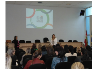
Capacitação referente à Vigilância Sociassistencial e aplicativos e sistemas do SUAS SST-SC (07-11)