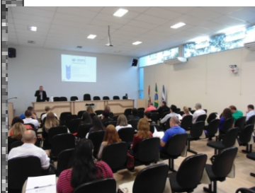
Sistema de informações sobre orçamentos públicos em saúde - SIOPS (01-02)