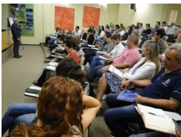
Encontro Estadual GMC e Seminário de Engenheiros e Arquitetos (15,16 e 17-08)