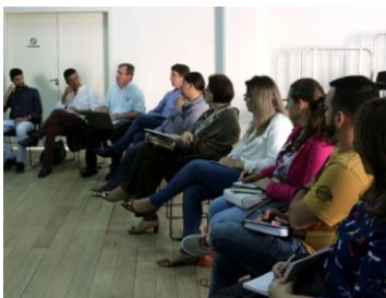
Colegiado Estadual de Cultura (11-09) e (21-11)