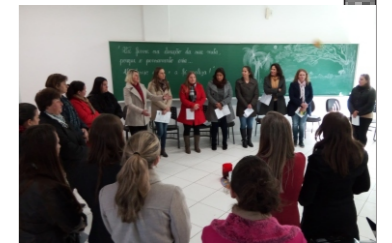
Palestra e Oficina educação alimentar e nutricional Jornada Pedagógica: Escola da Terra AMPLANORTE/ fevereiro e julho