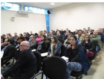
Capacitação Caixa Econômica Federal/SICONV (18-05)