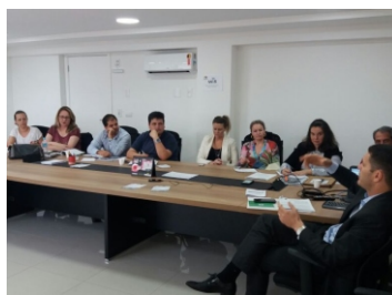
Seminário do TCE-SC Monitoramento dos Planos Municipais de Educação (17-10)