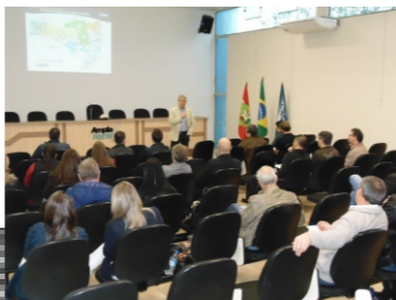
Planos municipais de saneamento/ARIS (24-08)