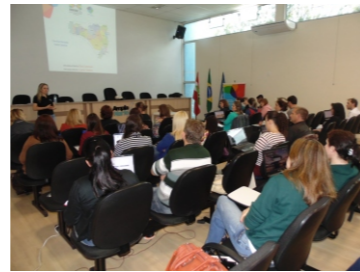
Capacitação CONVIVA (30-10)