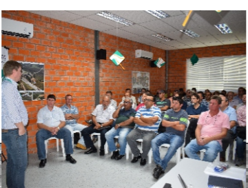
Capacitação para equipe de obras/Autopista (10/02)