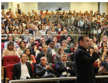
Conferência Regional de Defesa Civil – apoio da EGEM e AMPLANORTE (05-05)