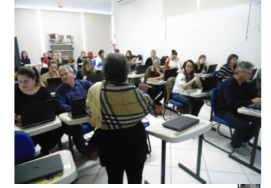
Capacitação Sipiá CT web –2017 (16 e 17-05)