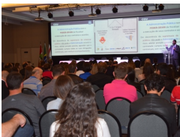
Seminário sobre a Gestão do Simples Nacional (21 e 22-08)