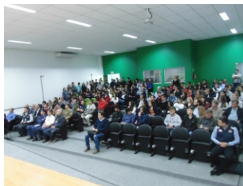
Colegiado Estadual de Educação (12-09) e (20-11)